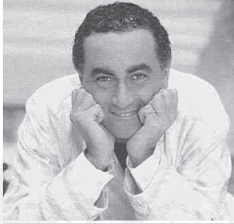
โดดี อัล ฟาเยด

มุสลิมนั้นแม้จะเป็นพี่น้องกันก็มีชื่อซ้ำกันมาก ฉะนั้นทุกคนก็จะเรียกเชรีฟาลูกสาวของเธอว่า “เชรีฟาน้อย” หรือ “Little Sherifa” เพื่อให้ไม่