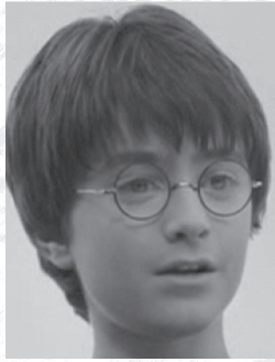
แดเนียล ผู้แสดงเป็น แฮร์รี พ็อตเตอร์