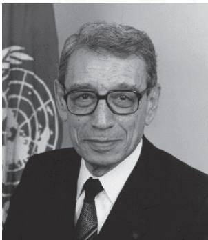
Mr. Boutros Boutros - Ghali

ท่านบอกว่า เลขาธิการองค์การสหประชาชาติคนปัจจุบันก็เป็น คนแอฟริกันคือ “นายโคฟี อันนัน” มาจากประเทศกานา ซึ่งดำรง ตำแหน่งนี้เป็นสมัยที่ ๒ แล้ว โดยเป็นตั้งแต่ ปี ค.ศ. ๑๙๙๗ และกำลัง จะหมดวาระสิ้นปี ค.ศ. ๒๐๐๖ นี้ เพราะเขาให้ดำรงตำแหน่งได้คราวละ ๕ ปีและไม่เกินคนละ ๒ สมัย พวกเรากำลังจะลุ้นกันอยู่ว่าคนต่อไปจะ เป็นใคร ดิฉันแสดงความเห็นว่า น่าจะเป็นคนทางเอเชียบ้างเพราะไม่ได้ เป็นมานานแล้ว ตั้งแต่ นายอูธมัน ชาวพม่าเคยเป็นอยู่ ๒ สมัย เมื่อ ค.ศ. ๑๙๖๑ - ค.ศ. ๑๙๗๑ จากนั้นก็ไม่มีชาวเอเชียได้เป็นอีกเลย มาคราวนี้ คนไทยที่มีคุณสมบัติพอจะส่งเข้าสมัครเพื่อเป็นตัวเลือก (candidate) ได้อยู่คนหนึ่งคือ “ดร.สุรเกียรติ์ เสถียรไทย” รัฐมนตรีว่าการกระทรวง ต่างประเทศของไทย เห็นว่ามีคู่แข่งที่น่ากลัวหลายคน โดยเฉพาะอย่าง ยิง “นาย บัน คี มูน” ชาวเกาหลีใต้ นั้นมีผลงานที่โดดเด่นเหลือเกิน