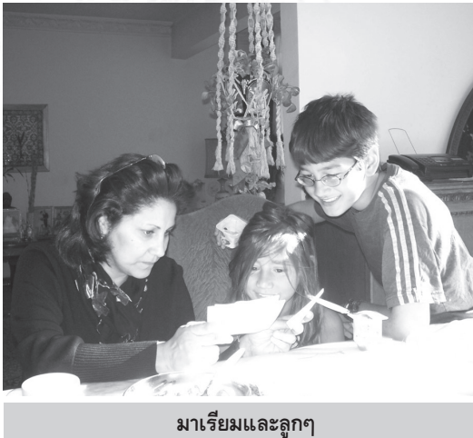
มาเยี่ยมและลูกๆ

ส่วน เซริฟา นั้น อายุ ๘ ขวบ ผิวสวย ผมสีน้ำตาลและตาคมกริบ หน้าตาน่ารักน่าชังเช่นกัน ทั้งสองคนพูดภาษาอังกฤษได้เหมือนเจ้าของภาษามาก เพราะกำลังเรียนในโรงเรียนอเมริกันทั้งคู่