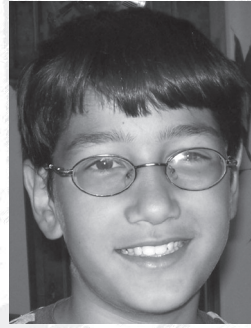
แชมมี่ ลูกชาย ของมาเรียม

พูดถึงนิยายเด็กชื่อดังเรื่อง แฮร์รี พ็อตเตอร์ ที่เด็กทั่วโลก ไม่เว้นแม้แต่เด็กไทยติดกันงอมแงมนี่ เด็กบางคนถึงกับบอกเพื่อนๆ ว่า ใครไม่เคยอ่านนิยายชุดนี้ ก็จะถูกกลายเป็นคนเซยหรือล้าสมัยไปเลย